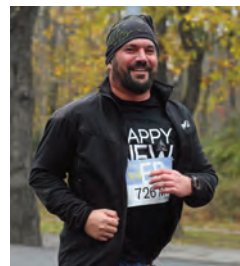
Andi mit Sportsgeist