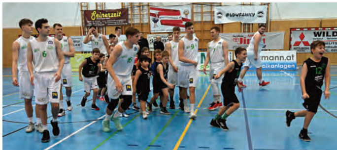
Xmas-Einlaufen des Alligators Nachwuchs mit dem B2L-Team

Die Herbstsaison 2019/20 hat alle Alligators-Teams und unsere treuen Basketball-Fans in ihren Bann gezogen und wir wollen in dieser Fotostrecke zeigen, warum Basketball der -für uns- schönste Sport ist.