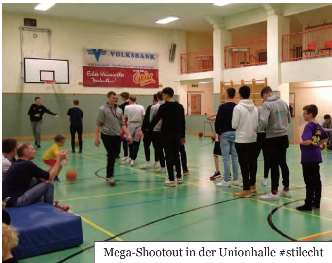
Mega-Shootout in der Unionhalle #stilecht