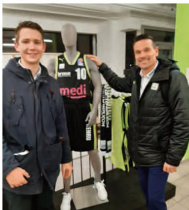
Nach dem Heimsieg ging's in den Merchandise-Shop